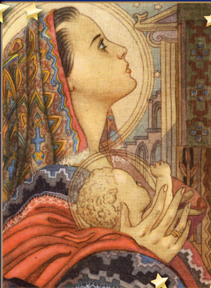
POSTKORT - AKVARELL AV TRYGVE M. DAVIDSEN

Et lite barn er født på jord. En utvalgt jomfru er hans mor.